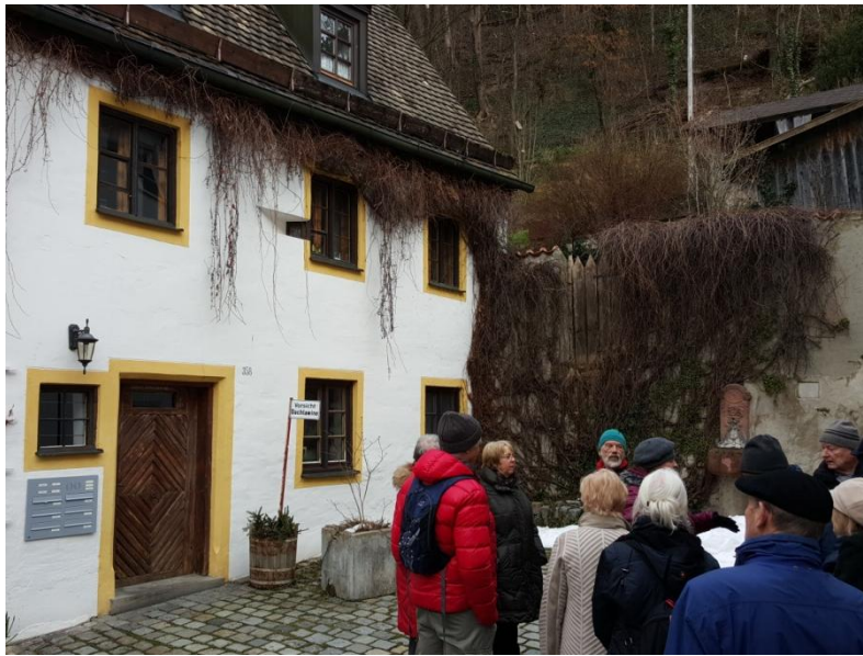
Das Blatternhaus. Am Fenster rechts über der Türe ist schießchartenähnlich das Kontrollfenster

den "Munichen" bauen ließ. Gleichzeitig wurde im heutigen Landsberg eine Brücke über den Lech geschlagen und damit der Umweg über eine riskante Furt ersetzt. Ziel war, die Herrschaft über den Salzweg von Bad Reichenhall nach Augsburg zu erreichen. Nachdem der Bischof von Freising ein Drittel der "Salzpfennige" erhielt, war er mit dem Rechtsbruch einverstanden. Die Salzstadel, heute zu begehrten und teuren Wohnungen in der Altstadt umgebaut, wurden damals extra dazu errichtet, das Salz zwangsweise, gegen Entgelt versteht sich, einzulagern.