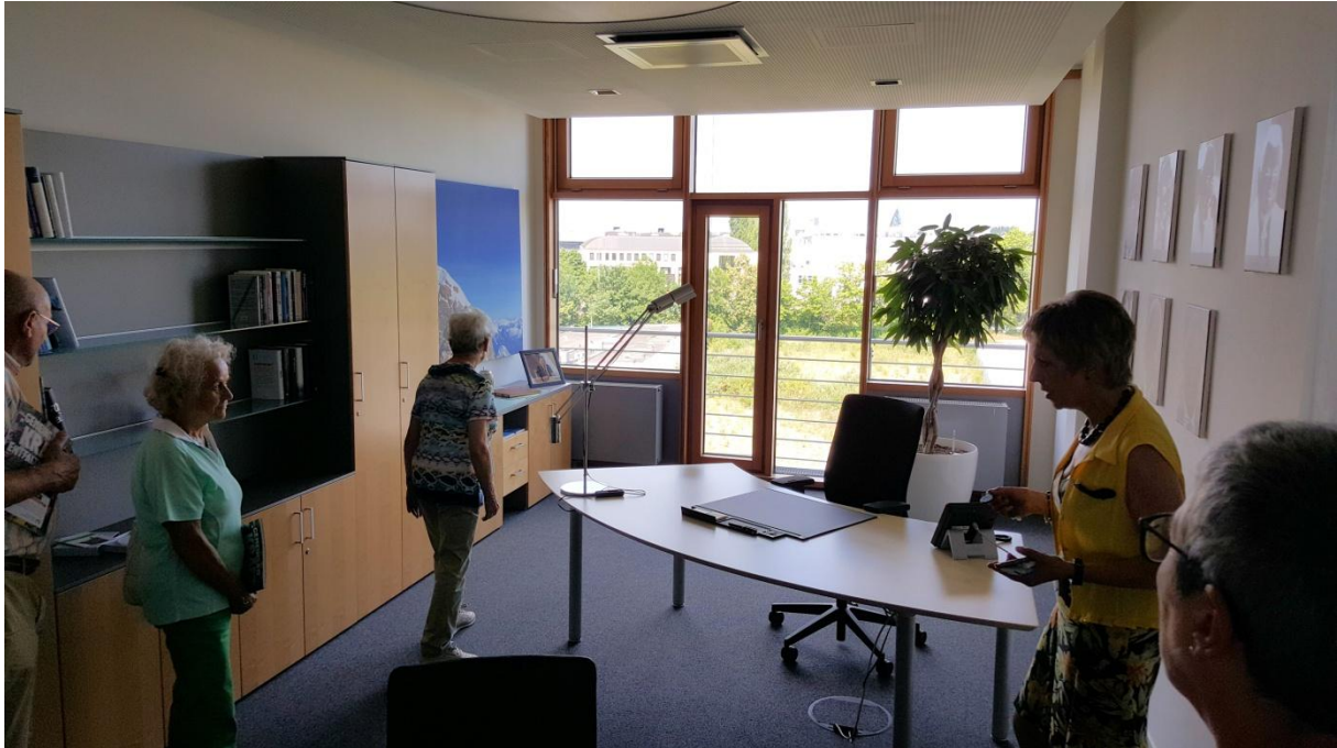
Das Büro des Parteivorsitzenden: An der rechten Wand die "Ahnengalerie der Parteivorsitzenden", links vorne an der Wand ein großes Foto von der Zugspitze und ein kleines Foto von Franz Josef Strauß